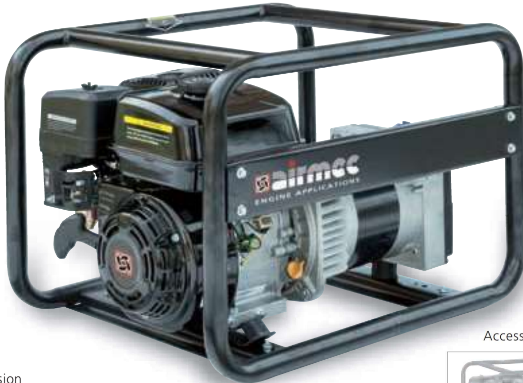
Accessorio - Accessory