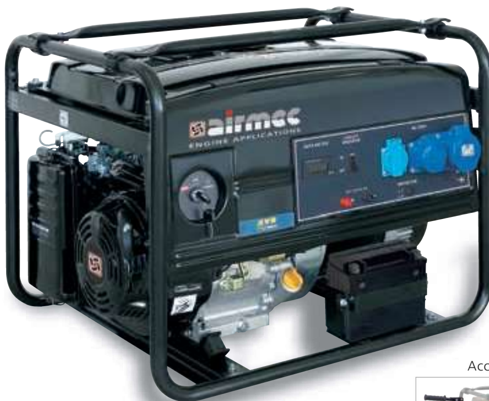
Accessorio - Accessory