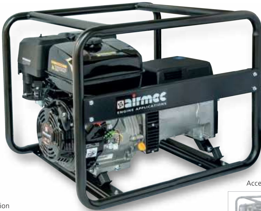
Accessorio - Accessory