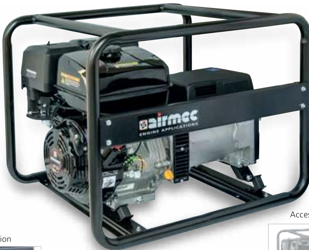
Accessorio - Accessory