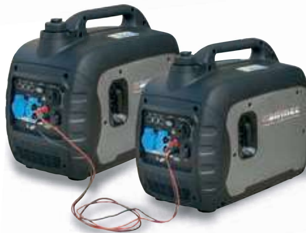
Collegabile in parallelo Connected in parallel

LED display pilot lamp e power indicator.