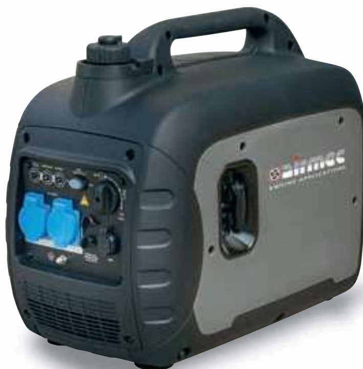
Ingresso Usb Usb plug